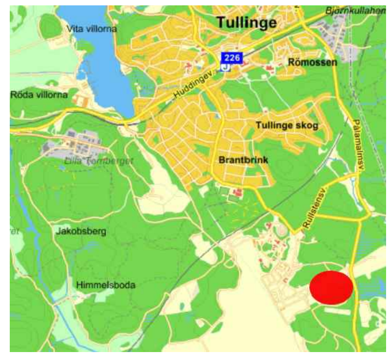
ORIENTERINGSKARTA ÖVER PLANOMRÅDET