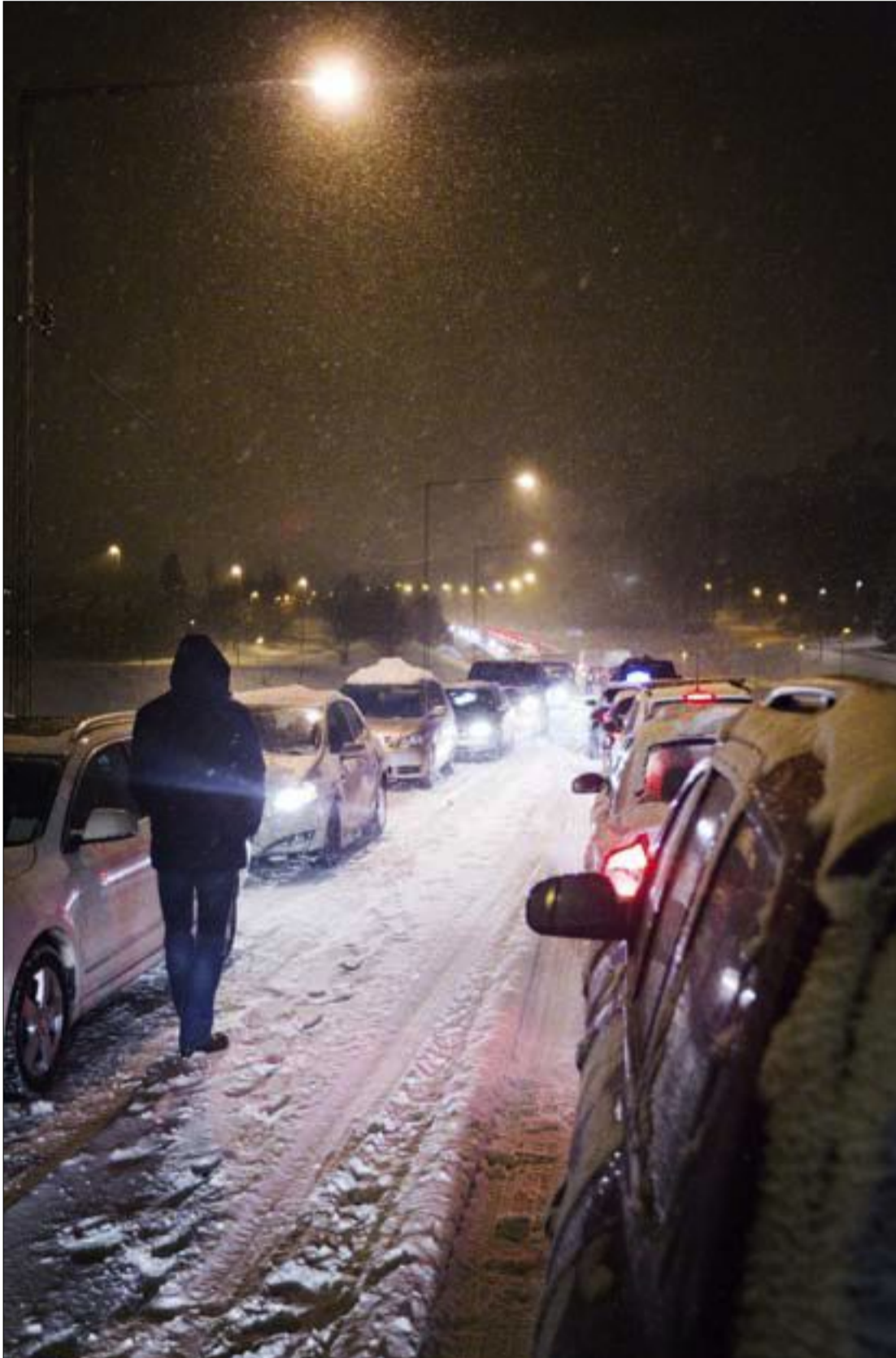
Bilkö från Tumba på väg 258 ut mot E20 under snökaoset.

Kommunen bombarderades med klagomål på snöröjningen