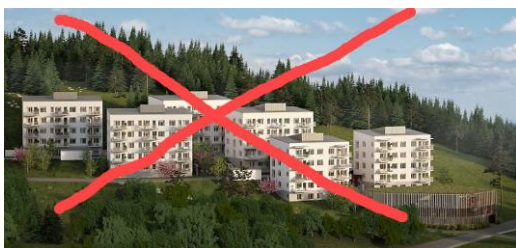
Tullingepartiet säger nej till bostäder som inte passar in i områdets karaktär.