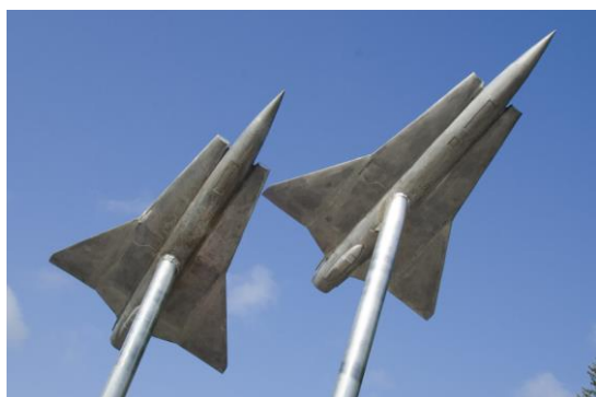
Flygplansmonument vid Riksten.

Monument håller minnet av flygflottiljen vid liv. Redan 2011 skrev Tullingepartiet en motion om att placera ett minnesmonument på en central plats i Riksten. Syftet var att levandegöra Tullinges historia och därmed påminna om all den aktivitet som funnits på området för länge sedan. Vi är därför otroligt glada att monumentet äntligen är på plats och vi vill rikta ett stort tack till de sponsorer som möjliggjort konstverket.