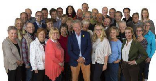
Några av Tullingepartiets medlemmar.