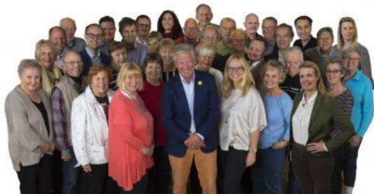
Några av Tullingepartiets medlemmar.